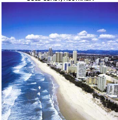
GOLD COAST, AUSTRALIA

Una cosa que poca gente no sabe es que Brisbane no tiene playa. Si vas a Brisbane podrás disfrutar de una playa artificial con palmeras y arena blanca en medio del corazón de la ciudad, aunque muy cerca de Brisbane se encuentran las mejores playas e islas de Australia, como la Gold Coast y Sunshine Coast.